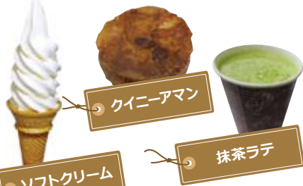
ソフトクリーム クイニアマン 抹茶ラテ