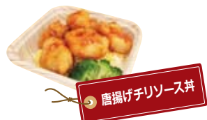
唐揚げチリソース丼