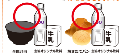
生協弁当 生協オリジナル飲料 焼きたてパン 生協オリジナル飲料