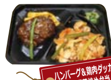
ハンバーグ&鶏肉ダッカルビ風野菜炒め弁当