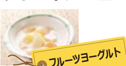
フルーツヨーグルト