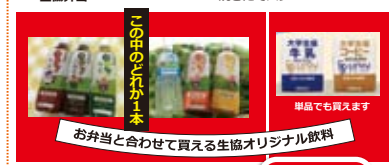
お弁当と合わせて買える生協オリジナル飲料