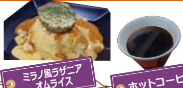
ミラノ風ラザニアオムライス ホットコーヒー