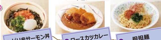
ピリ辛サーモン丼 ロースカツカレー 担担麺