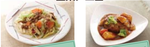
豚肉と野菜の生姜炒め シチューダバーク