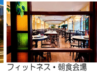
フィットネス・朝食会場

※上記ホテルのバスタブ付のツインベッドのお部屋をご用意いたします。ダブルベッドになることがあります。3人で1部屋ご利用の場合、2部屋に簡易ベッドを入れ、3名様でご利用頂くため手狭となります。簡易ベッドの搬入時刻は夜遅くなるのが一般的です。ホテルチェックインの際、ホテルより国際クレジットカードの提示または現金によるデポジット(保証金)を求められることがあります。ご参加の際には国際クレジットカードをお持ちになることをお勧めします。