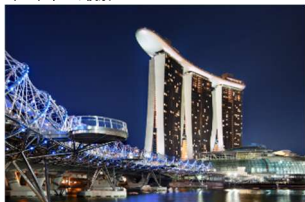
マリーナベイ夜景