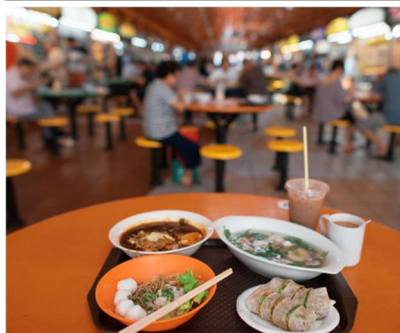
ホーカー (屋台街) とローカルフード