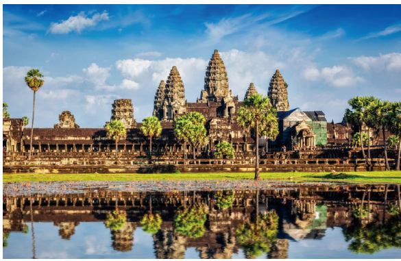
フリータイム時:アンコールワット(イメージ)