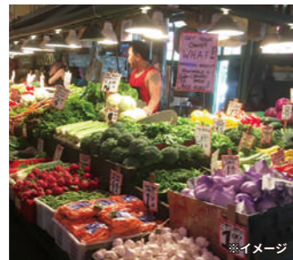
バイクマーケットプレイス