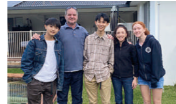
ホームステイイメージ

現地受け入れ団体：GPI-NA 所在地：バンクーバー GPI-NAはカナダのホームステイプログラムを運営する現地教育団体です。