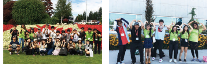
キャンパスツアー&交流イメージ

名門プリティッシュコロンビア大学を訪問し、大学生と交流します。海外の大学の様子を感じたり、学生たちと専攻や将来の目標などについてお互い質問しあえる機会をご用意しています。