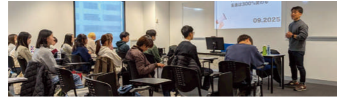
ゲストスピーカーセッションイメージ

ゲストスピーカーセッションではカナダで働く日本人や、UBCの教授をゲストとして予定しています。セッションを通して将来のキャリアを考える機会を提供します。(スピーカーの決定は研修の直前となります。)