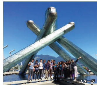
オリンピック聖火台での記念撮影