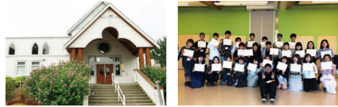
スタディセンターイメージ

参加者だけの英会話レッスンで挨拶や簡単な質問などをマスター！ホームステイ先〜スタディセンター間の往復送迎もついているので安心！最終日には修了証書をお渡しします。