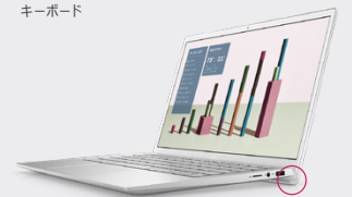
ラバー ドロップ ヒンジ