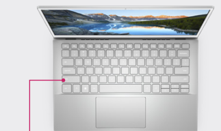
バックライト キーボード

ラバー ドロップ ヒンジが本体をわずかに持ち上げ、快適なタイピング角度を確保。手の操作が楽になり、長時間作業での負担を軽減。また、温度プロファイルを最適化する適応型サーマルが、より快適な作業環境を提供。